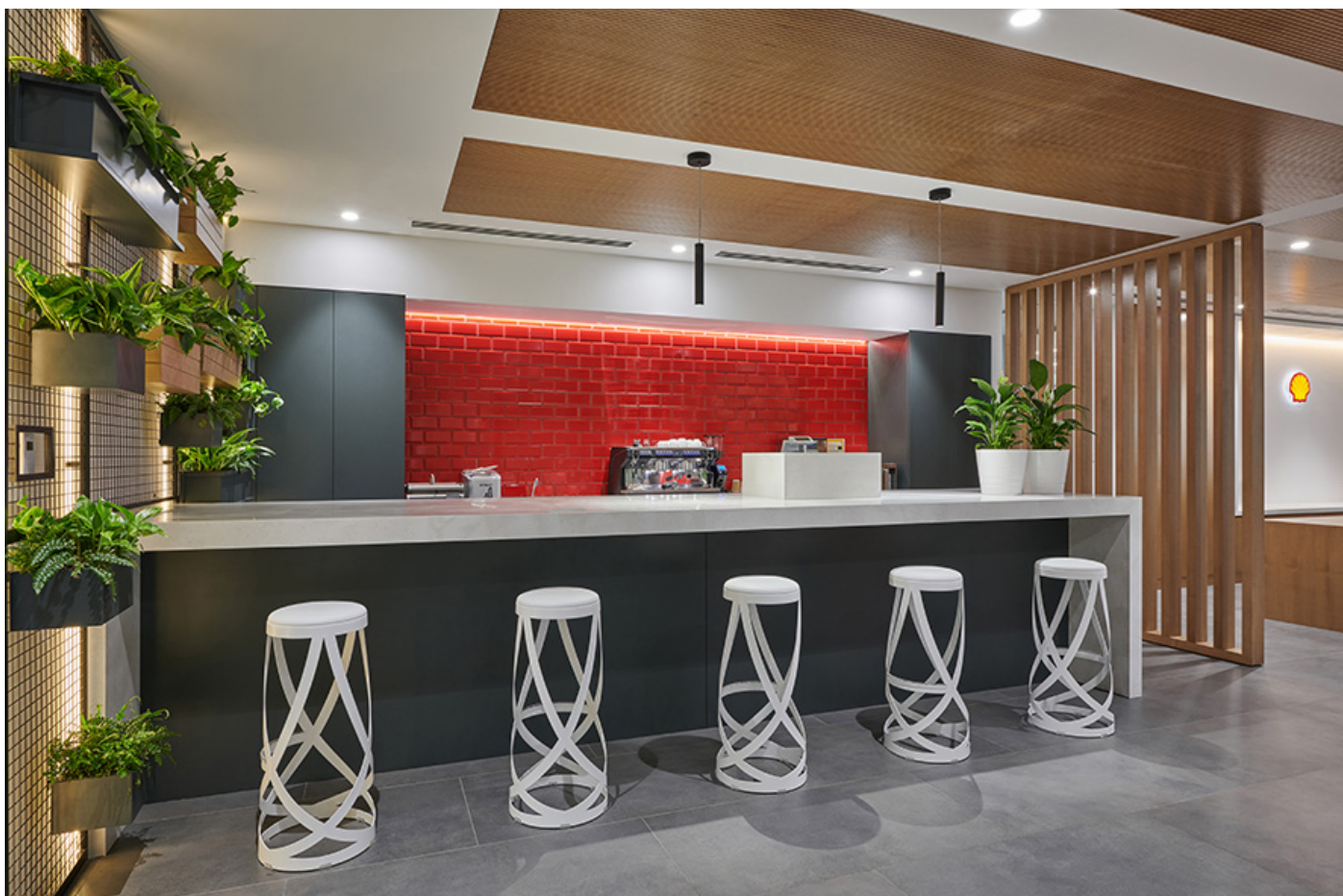
Das Shell Café, auch bekannt als Energy Hub, ist farbenfroh gestaltet. Wie der Empfangsbereich, definiert auch dieser Raum mit seinem innovativen Design und dem Bekenntnis zur Nachhaltigkeit die Identität von Shell.