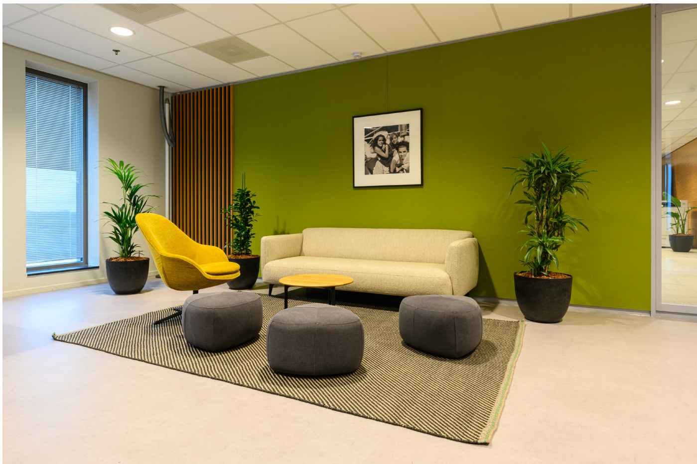
Räume mit ruhigem Ambiente, von der Gastronomie inspiriert.