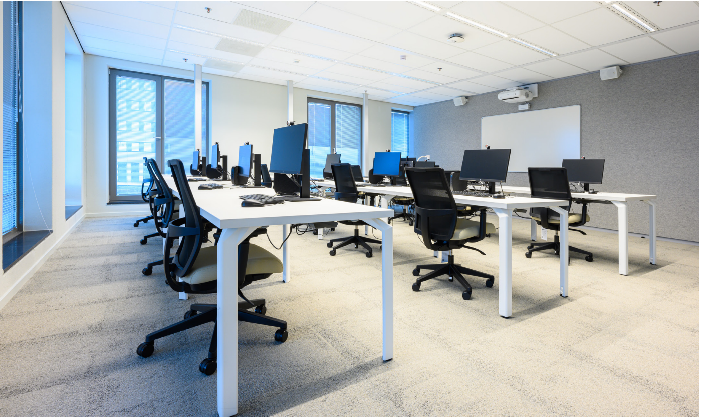
Auch in den Arbeits-, Schulungs- und Pausenbereichen wurde auf Ergonomie und Sitzkomfort geachtet.